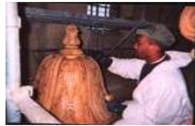
Photo 3 : Cette vasque de fruits en bois sculpté est au faite de l'orgue, elle est trop loin des yeux pour que l'on puisse en admirer les détails. Les travaux de restauration ont permis de l'approcher au plus près.

Photo 2 : Ne croyez pas qu'il s'agisse d'une cloche, ici nous avons un des clochetons en bois repeint qui décore le haut du buffet de l'orgue nettoyé et mis en cire.