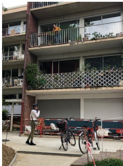
Claude (au balcon)